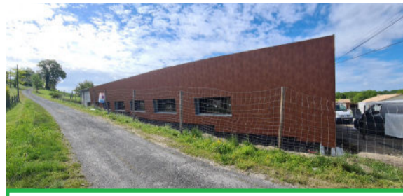
Ribagnac : Création d'une nouvelle maison médicale (40 000 € en 2023 des Fonds de Concours de la CAB)

22 Ribagnac Création d'une maison médicale : 35 000 € Réhabilitation d'un logement : 16 000 € Lotissement communal : 35 394 €