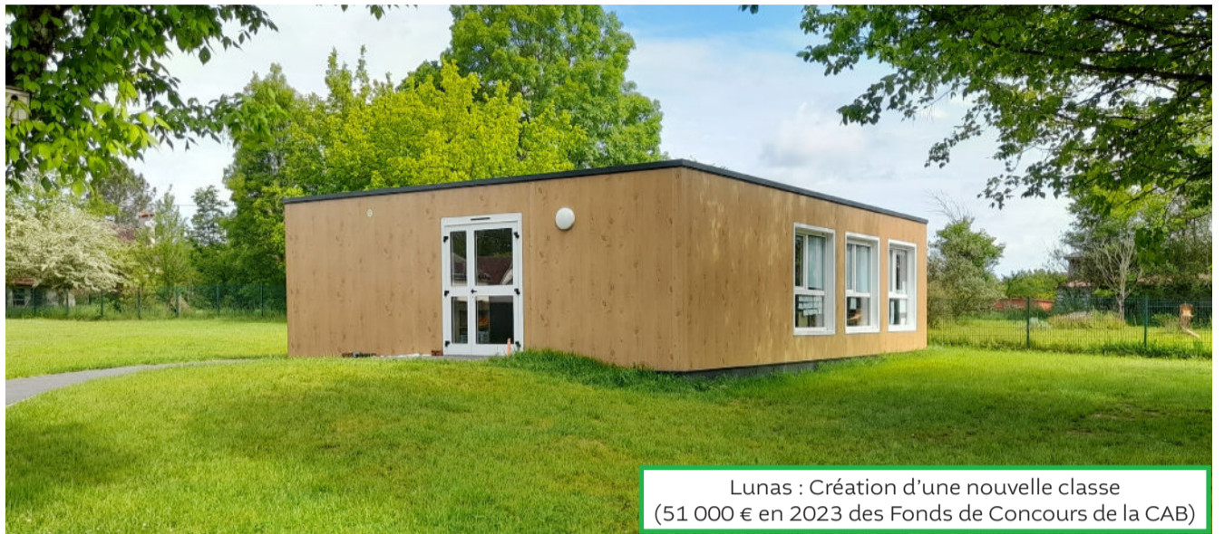
Lunas : Création d'une nouvelle classe (51 000 € en 2023 des Fonds de Concours de la CAB)

Ci-contre, les projets portés par vos communes et financés par la CAB qui seront réalisés près de chez vous.