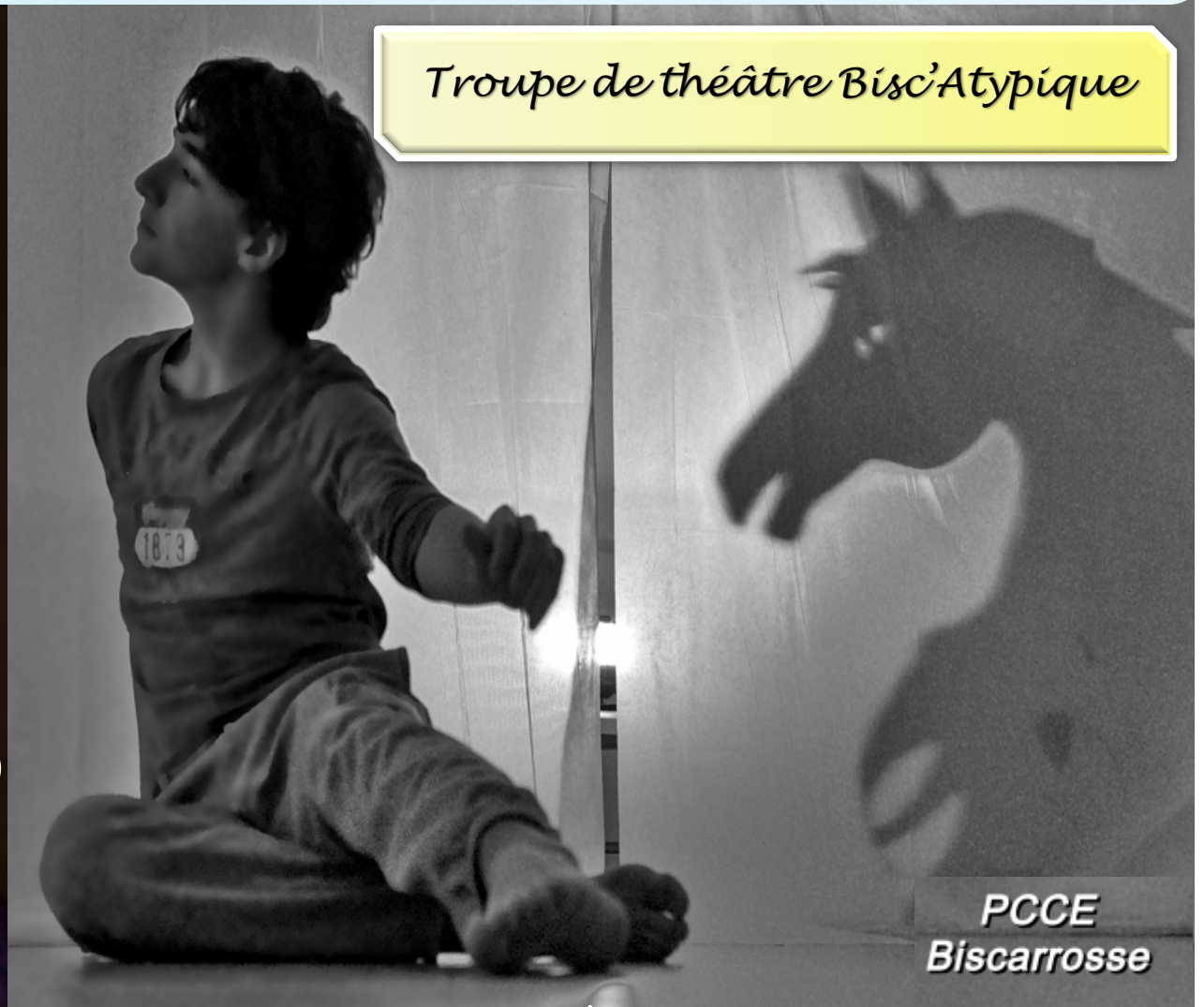
Troupe de théâtre Bisc'Atypique