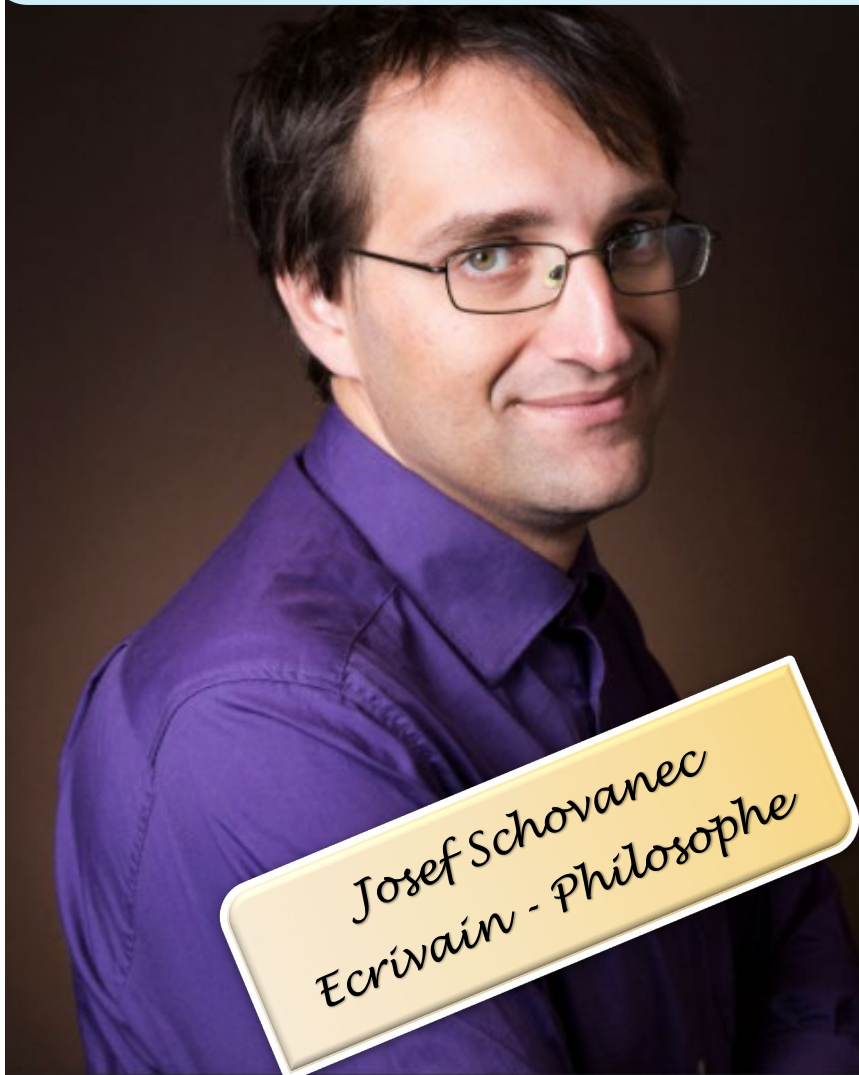
Josef Schovanec Ecrivain - Philosophe

Sensibilisation à l'Autisme du 18 Septembre au 03 Octobre 2021