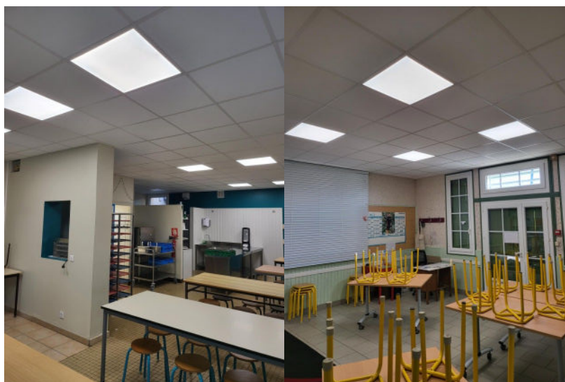
Travaux d'isolation plafond et de l'éclairage de la cantine et de la garderie

bibliotheque.saintgermainetmons@la-cab.fr .