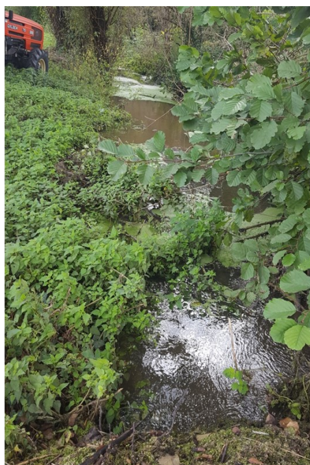
Fossé avant entretien