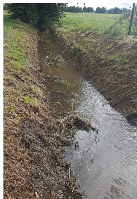
Fossé après entretien

Tout riverain doit maintenir le libre écoulement des eaux s'écoulant sur sa propriété. Il est donc interdit de créer ou de conserver un obstacle pouvant empêcher l'écoulement dans les fossés. Tout propriétaire riverain d'un fossé se doit de procéder à son entretien régulier afin qu'il puisse permettre l'évacuation des eaux en évitant toutes nuisances à l'amont et à l'aval du fossé.